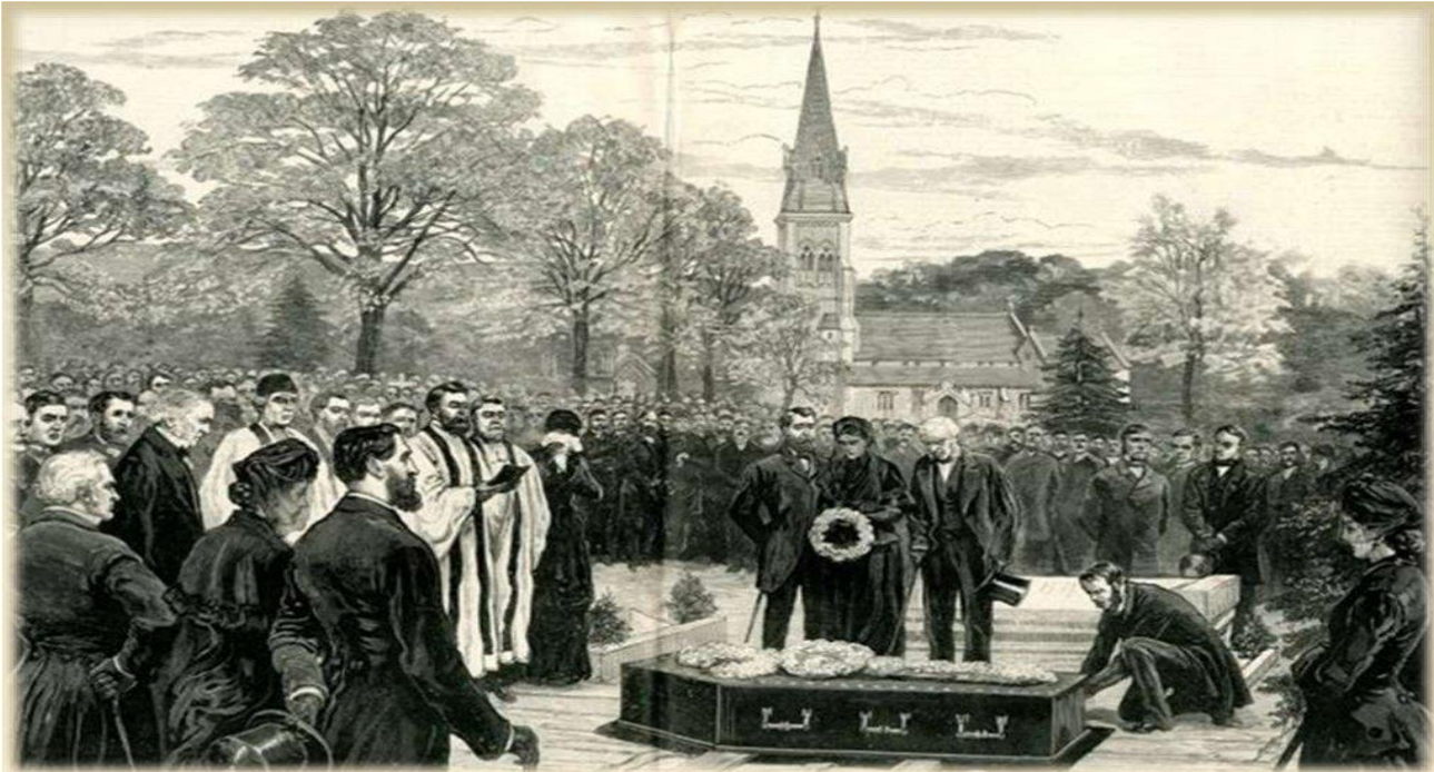
Но провожать в последний путь «святого доктора» пришли больше 20 тысяч человек. Гроб с телом доктора несли на руках. Это было в августе 1853 года.

Zu seiner Beerdigung kamen 20.000 Menschen. Der Grabstein ist lateinisch beschriftet und trägt auf russisch das Haass-Zitat: „Beeilt euch Gutes zu tun“.